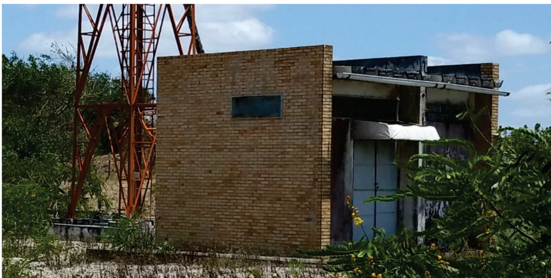
Figura 03 – Vista da edificação