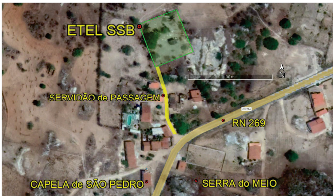
Figura 01 – Imagem de satélite com a implantação da ETEL em Serra de São Bento-RN.