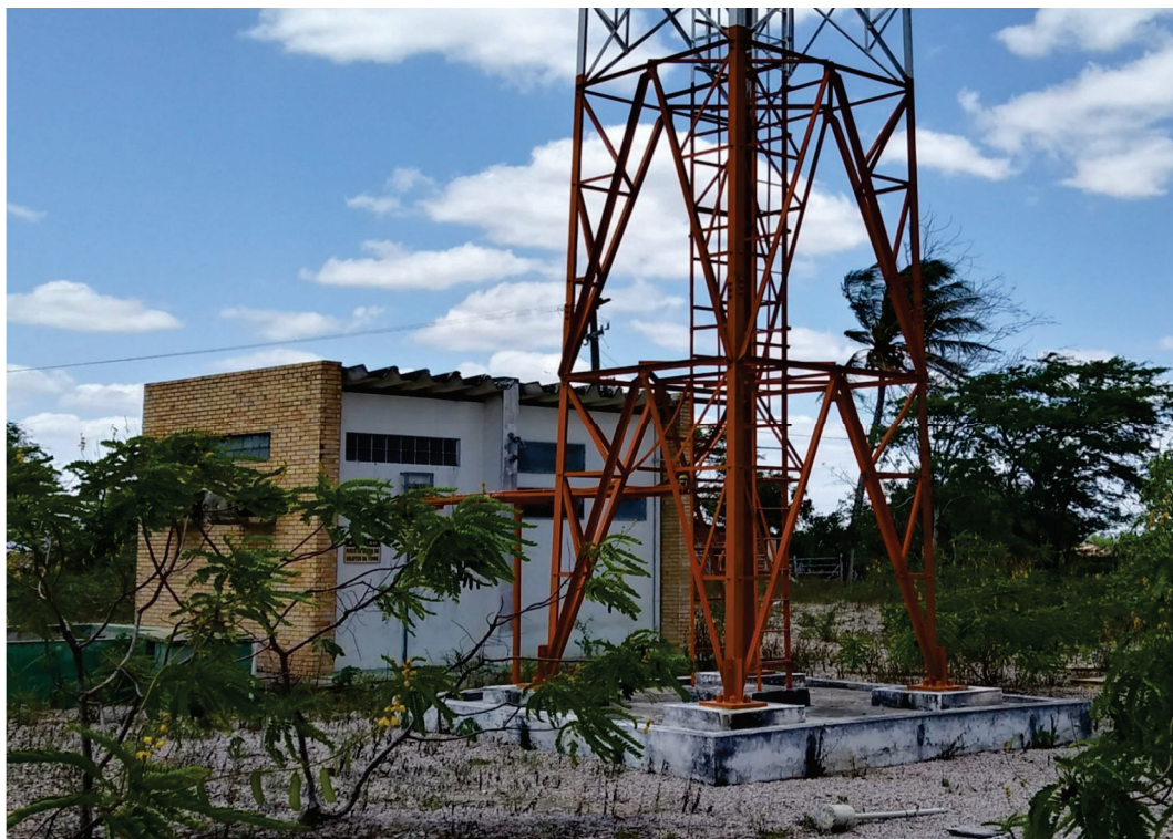
Figura 02 – Vista da torre metálica e da edificação de apoio