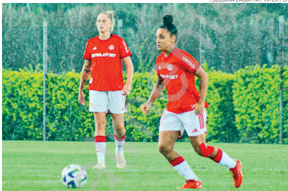
As Gurias Coloradas não perderam nenhum jogo dentro dos seus domínios